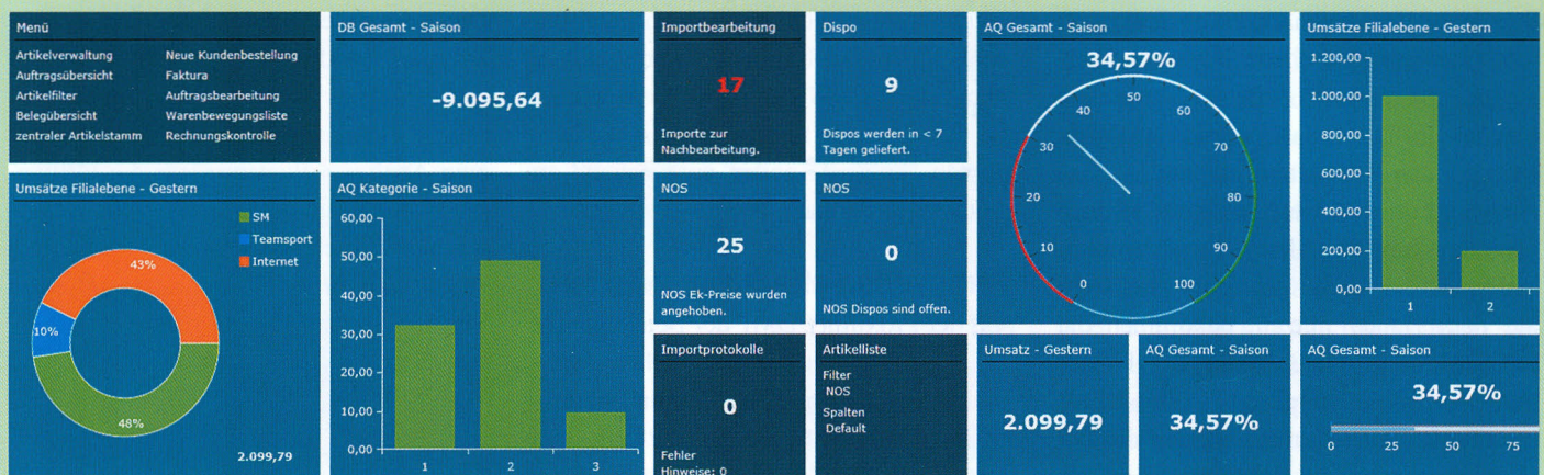
Auf dem Homescreen von Ipos werden alle relevanten Kennzahlen übersichtlich angezeigt.